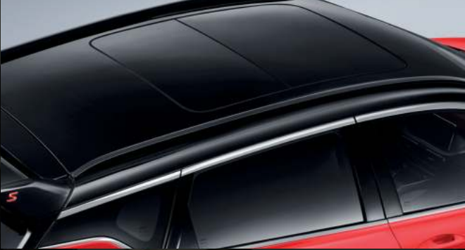
فتحة سقف بانورامية