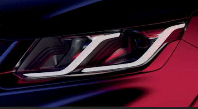
مصابيح أمامية نهارية LED