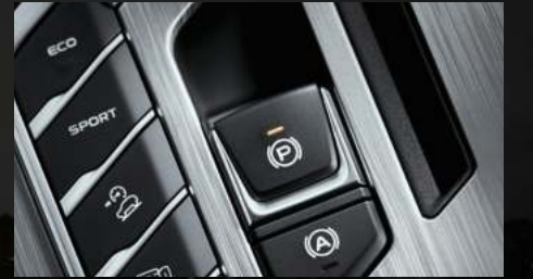
مكابح كهربائية (EPB)

اختيار وضعيات القيادة (راحة، رياضية، صديق للبيئة)