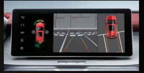
نظام الرؤية المحيطة 360 درجة (4 كاميرات) مع نظام ترفيهه بشاشة قياس 10,25 بوصة