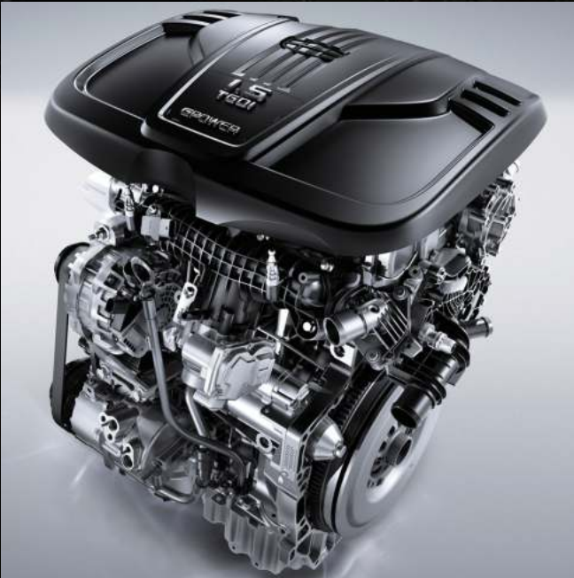
محرك 1.5 TD و 7 سرعات DCT

اختيار وضعيات القيادة (راحة، رياضية، صديق للبيئة)