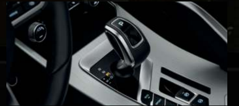
ناقل الحركة الكهربائي

التسارع من 0-100 كم/ساعة: 7.9 ث استهلاك الوقود لكل 100 كيلومتر: 6.6 لتر أداء عالي بديناميكيات قيادة ممتازة