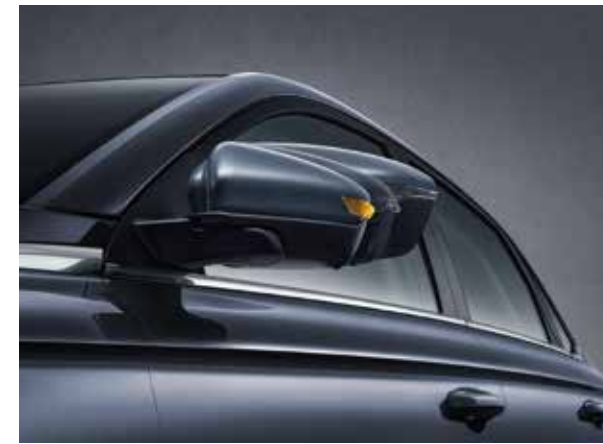
ئاوپنهى هيلكارى ئوتوماتيكي