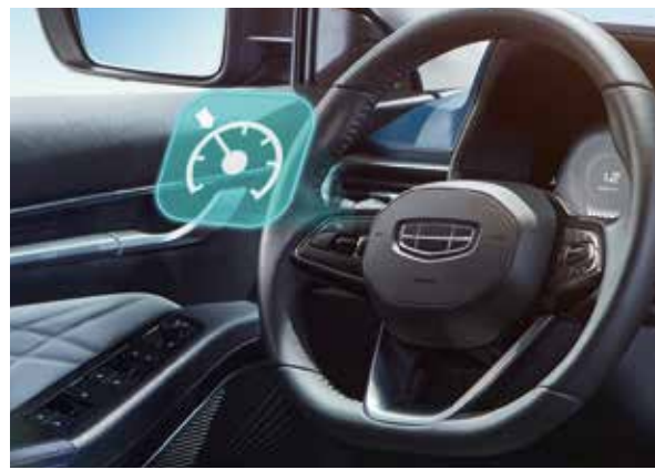
سيستمى كونترول كردنى خيراىى