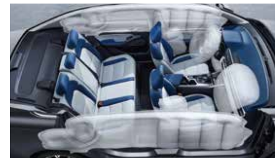
6 ئه پيرباگى له گهه سيستمى تهواوكه رى خوكرتنى چووله و پهستان