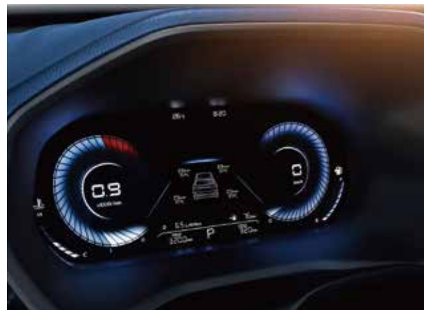
شاشهى ديجيتالى 12.3 ئينچ