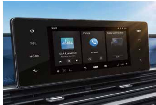
شاشهى ناوهراس 8 ئينچ