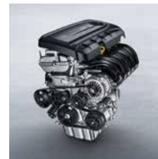
بزوينهى 1.5L و سووته مهنى گهه به كارهينه ره