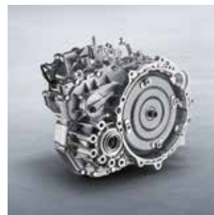
گيڤى 8 نمره يى