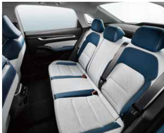
نزيكهى 1.5م فراوانى له پشتهوه