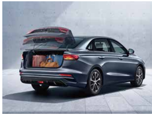
سندوقى دواوهى ئوتوماتيكي