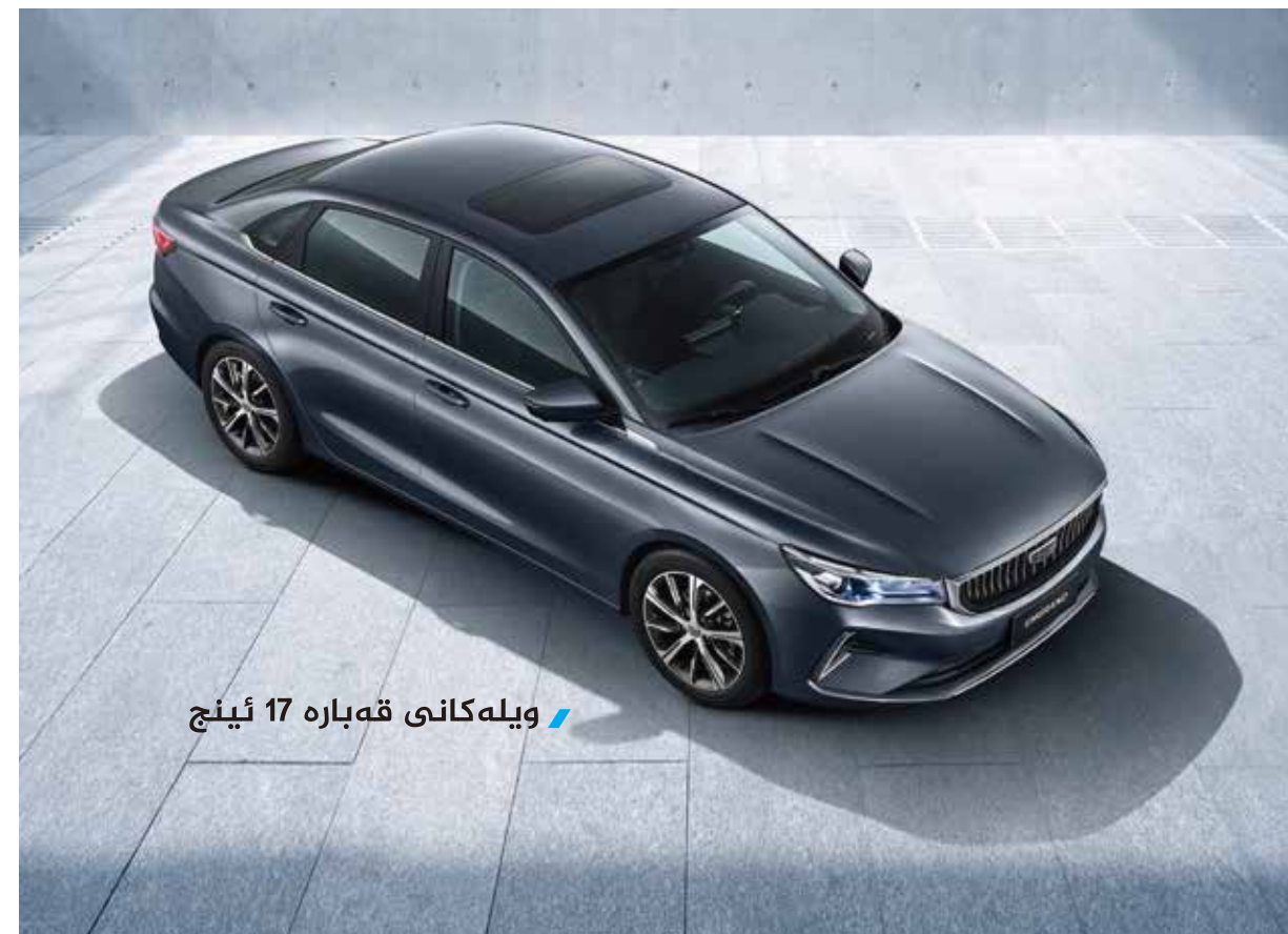
ويله كانى قه باره 17 ئينچ