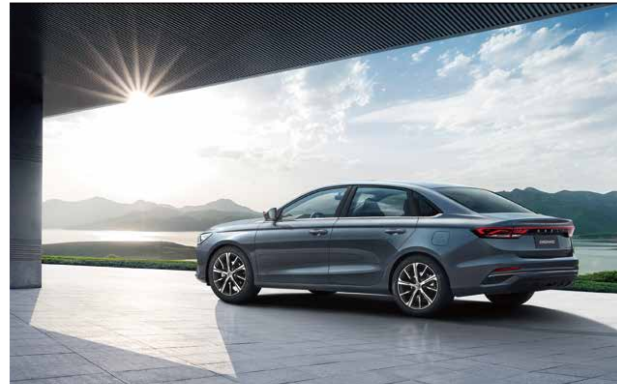
لايتى دواوهى شيوه شه پولى ناوازه