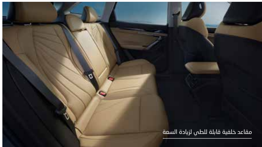
مقاعد خلفية قابلة للطي لزيادة السعة