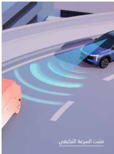
مثبت السرعة التكيفي