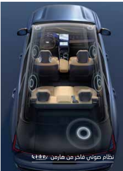
نظام صوتي فاخر من هارمن هيلف