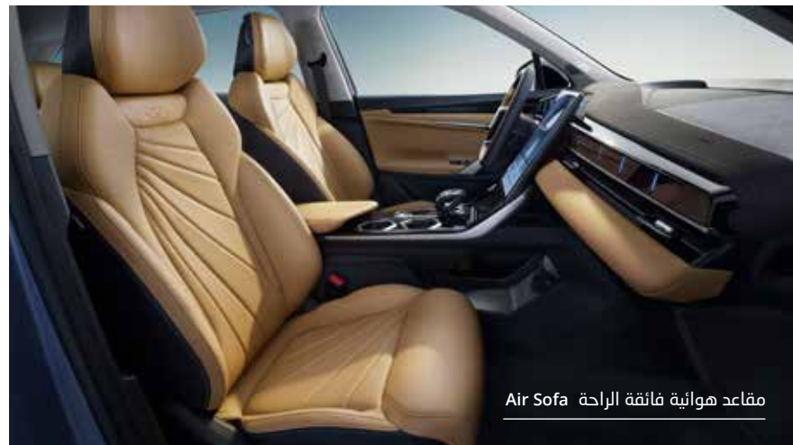
مقاعد هوائية فائقة الراحة Air Sofa