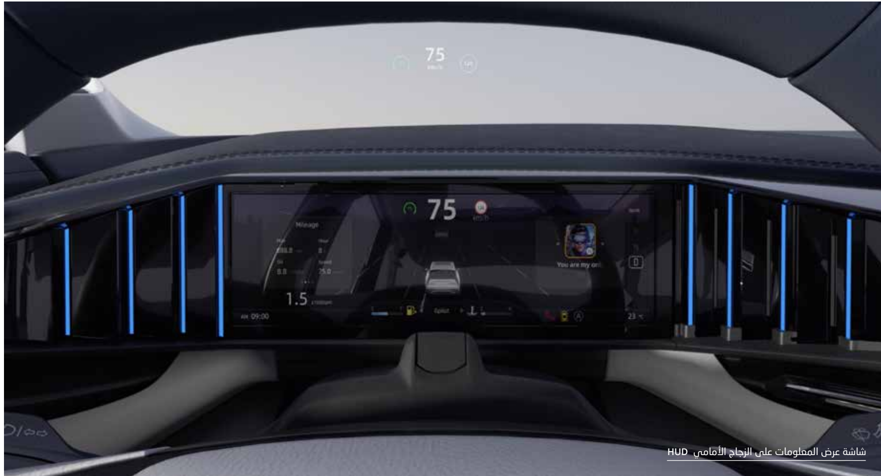
شاشة عرض المعلومات على الزجاج الأمامي HUD