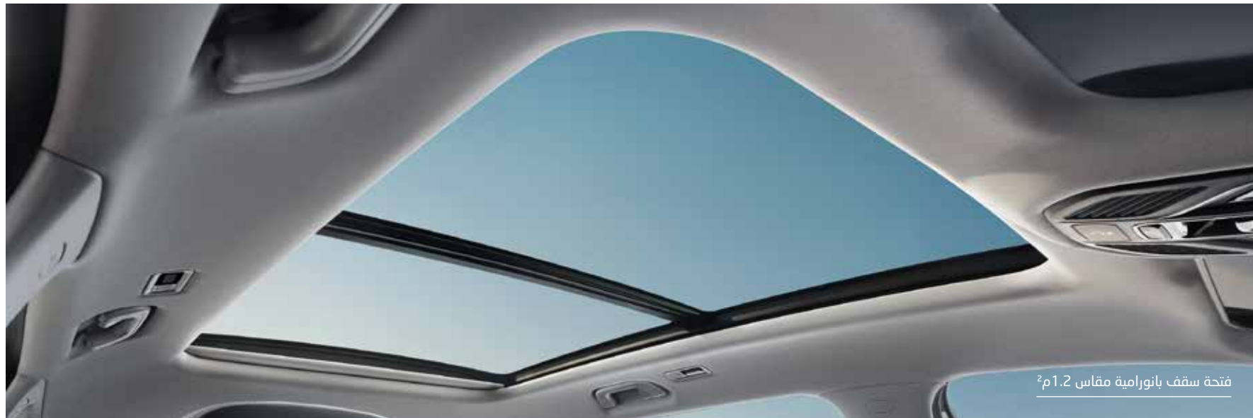
فتحة سقف بانورامية مقاس 1.2م 2