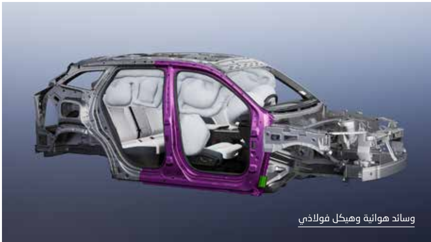
وسائد هوائية وهيكـل فولاذي