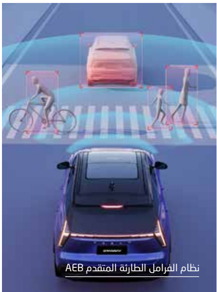
نظام الفرامل الطارئة المتقدم AEB