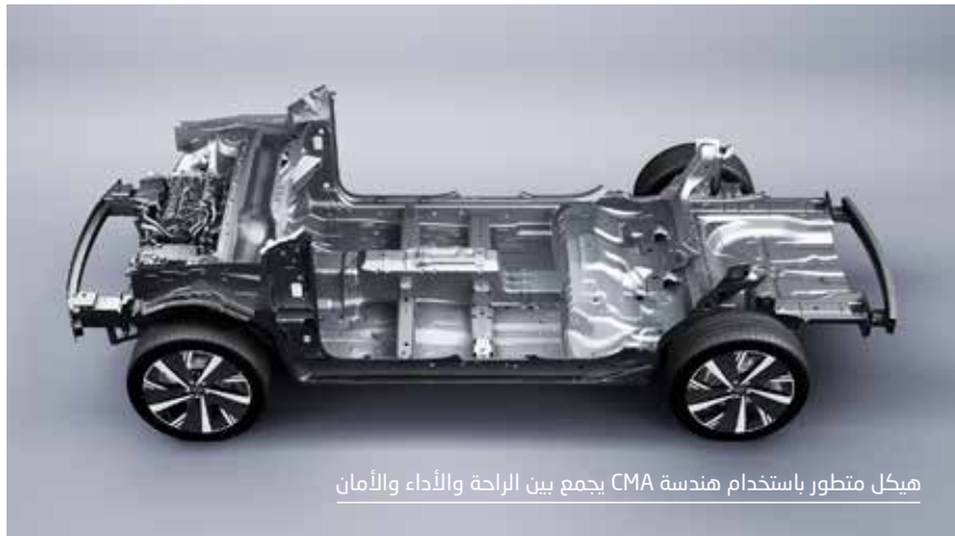
هيكـل متطور باستخدام هندسة CMA يجمع بين الراحة والأداء والأمان