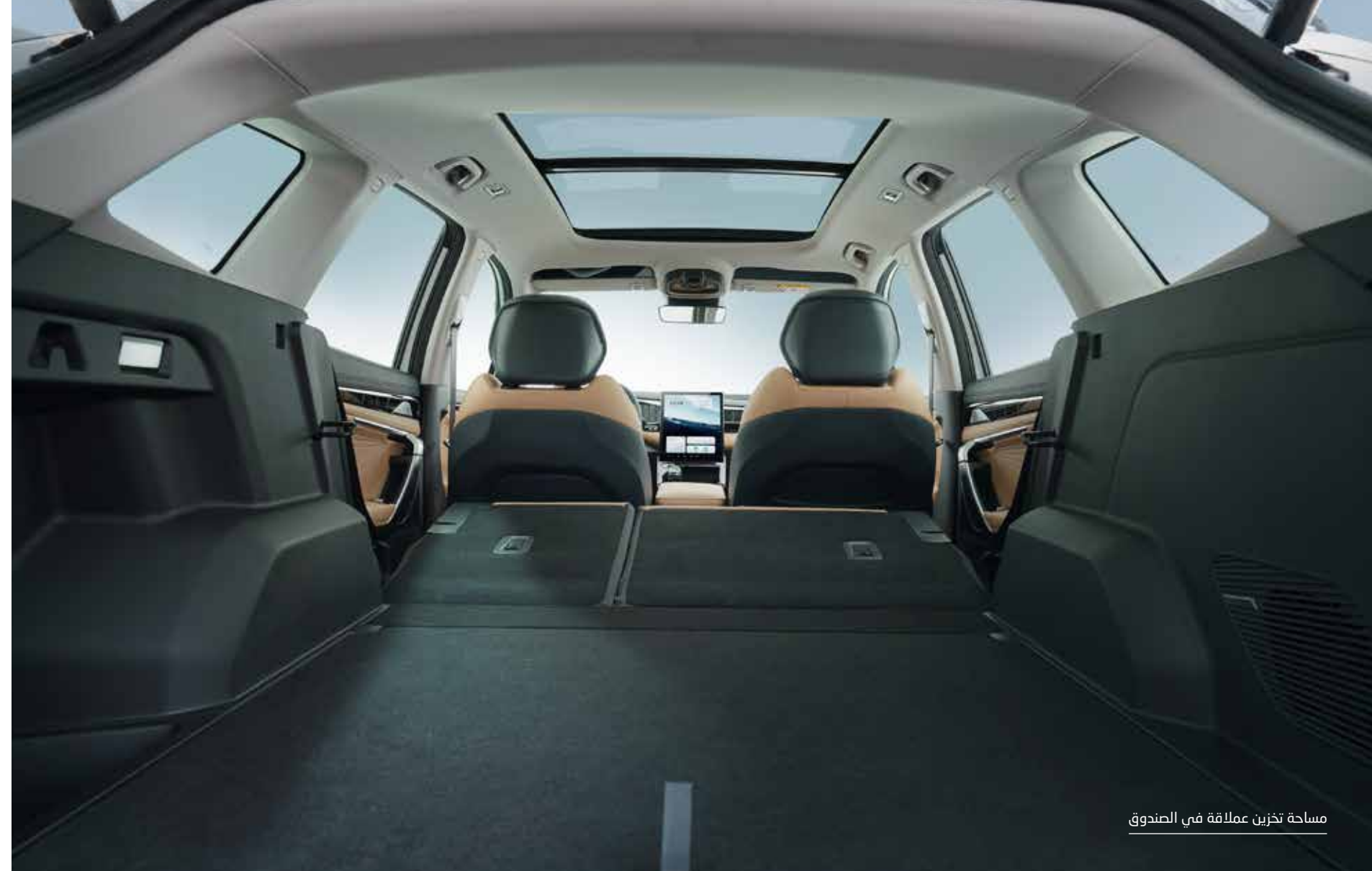
مساحة تخزين عملاقة في الصندوق