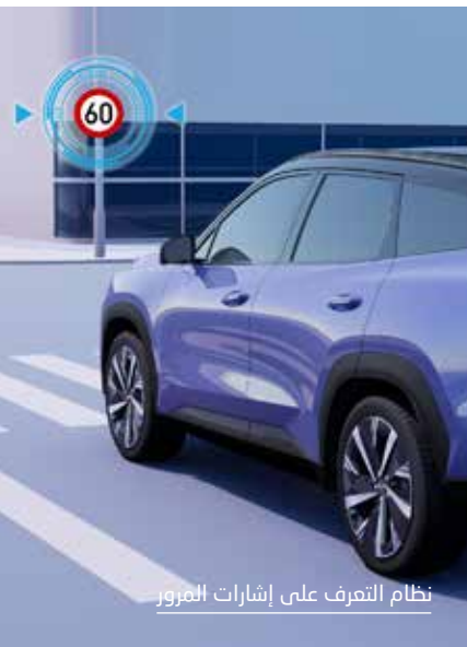
نظام التعرف على إشارات المرور